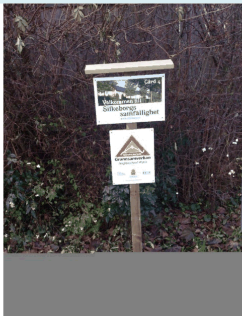
Ett bra exempel på att informera om att de boende har grannsamverkan.